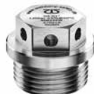
MA-104841-275 Sprängbleck 275bar, BSPP 1/4", Stainless steel 1.4404