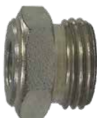
Adapter GA-2513 utv 5/8"-18 x inv VG8 Schrader lång version