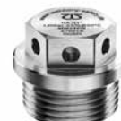
MA-104841-330 Sprängbleck 330bar, BSPP 1/4", Stainless steel 1.4404