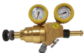
Regulator GLT1615W2432R inv W24,32 gasflaska