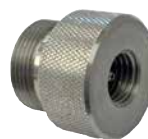
Adapter GA-HT-A12 utv M28x1,5 x 1620