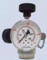
Ventilenhet GLT-B2157 ingår i kit PC280/70 inv 5/8"-18 UNF