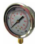
Manometer MANO063 Analog, dia 63mm, glycerinfylld, tryckområde, se sep spec, ansl nedåt 1/4"