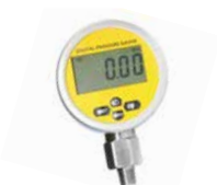
Manometer MANO080 Digital, dia 80mm, tryckområde, se sep spec, ansl nedåt 1/4"