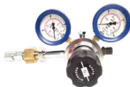
Regulator GLT-B2494 inv W24,32 gasflaska