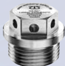
MA-104841-210 Sprängbleck 210bar, BSPP 1/4", Stainless steel 1.4404