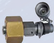
Adapter GA-B2168-1615 inv W24,32x1/14 x utv M16x1,5