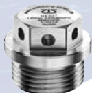
MA-104841-250 Sprängbleck 250bar, BSPP 1/4", Stainless steel 1.4404