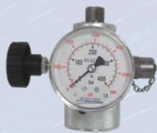
Ventilenhet GLT-HT2155 ingår i kit PCFPU 280/70 inv M28x1,5 m pin Parker/Hydac