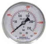
Manometer MANO-GASVENTIL-250 Analog, dia 63mm, torr, 0-250bar, ansl bakåt