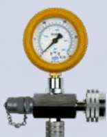
Ventilenhet GLT-1087-HYDRO-W24 inv W24,32 gasflaska