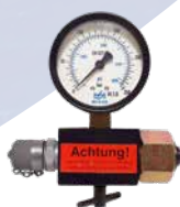
Ventilenhet GLT1620W2432 ingår i kit 5114 inv W24,32 gasflaska