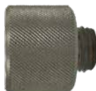
Adapter GA-2514 utv 5/8"-18UNF x inv 7/8"-14UNF Lång version