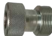
GA-2431 utv M28x1.5 x inv 5/8"-18UNF Master adapter