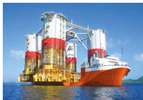
Offshore hydraulik och pneumatik