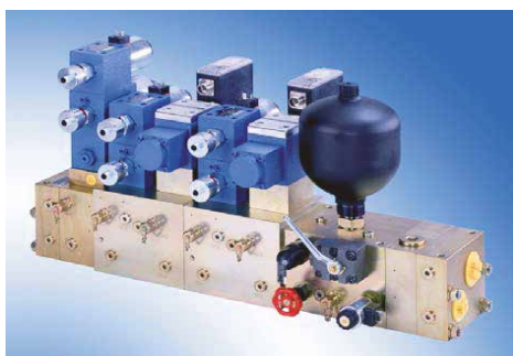
Industriell hydraulik och pneumatik