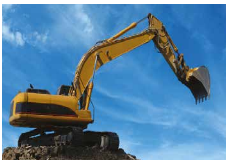
Mobil hydraulik och pneumatik